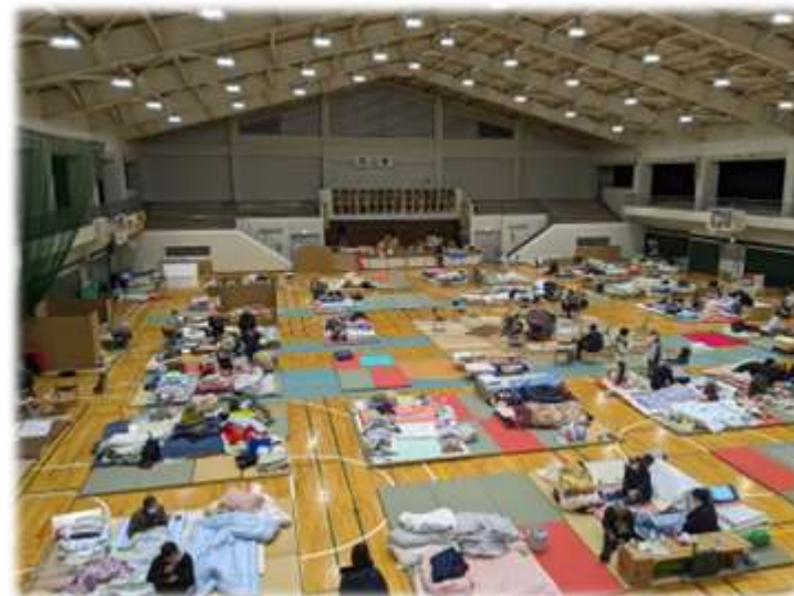
避難所の様子（1月8日 七尾市内）