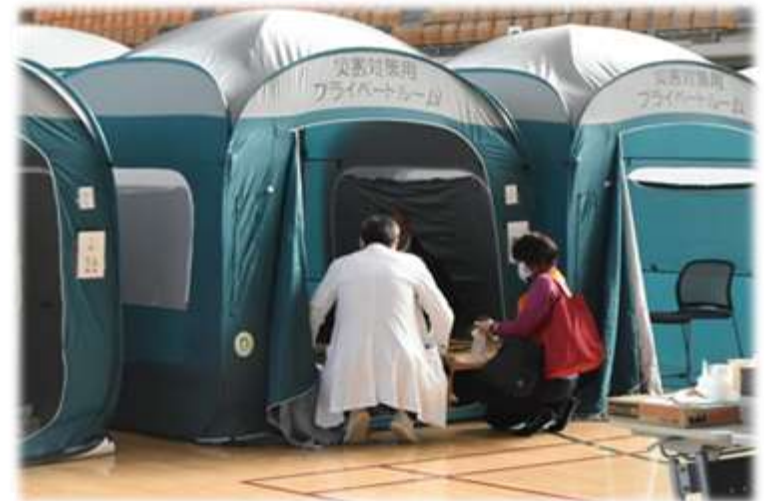
1.5次避難所の医療サービスの様子 (いしかわ総合スポーツセンター)